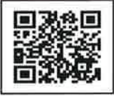
サルビアスタッフブログ

7月1日より英世会クリニック事務からサルビア事務に異動になりました。医療事務を8年間経験し、介護施設の事務は初めてとなります。出身は長野県で、進学で日野市に移り住みました。高幡不動尊の紫陽花やお祭り、ふれあい橋からの景色が大好きで16年ほど住んでいました。介護施設の事務という新しいフィールドで分からない事が多いので、色々教えて頂ければと思います。宜しくお願いします。