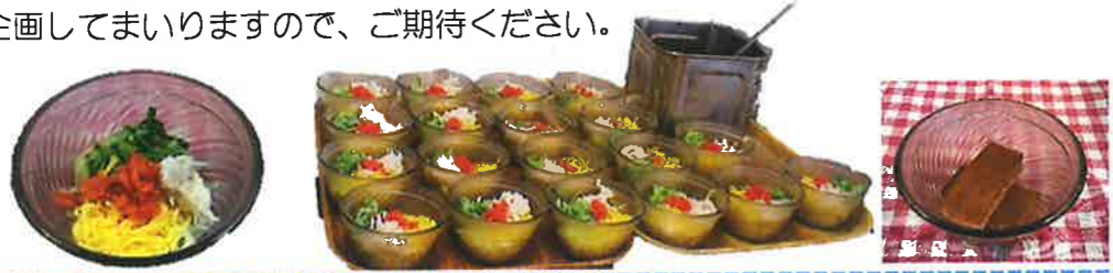
冷やし中華を食べられない方には素麺 寒天を召し上がっていただきました

夏にぴったりのレクリエーションとして、冷やし中華を提供するイベントを開催しました。初めての試みでわからない事だらけで、例えば「たれはオーソドックなものが良いのか、それとも胡麻だれが良いのか、量はどれくらいが適切なのか、上に乗せる具材は何が良いのか」など、様々なことを悩みながらの実施となりました。皆様に喜んでいただけるか不安もありましたが好評のうちに終え、夏を吹き飛ばす楽しいひと時となりました。今後も季節に合わせたレクリエーションを企画してまいりますので、ご期待ください。