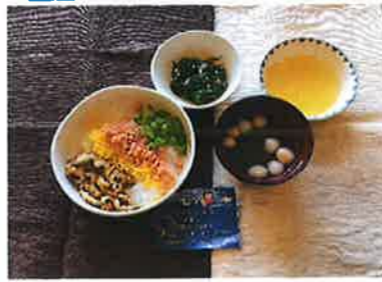
七夕ちらし寿司・すまし汁 春菊の煮びたし りんごとパイナップルすりおろしゼリー