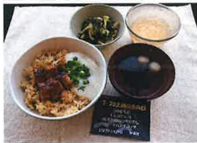
うなとろ丼 しじみだし汁 青菜と揚げの煮浸し ピーチバナコッタ