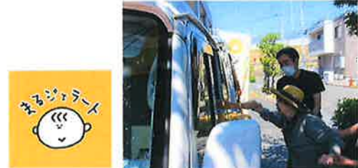
まるジェラートで検索してみてください。