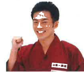
介護の「ご」予防の「ぼう」で ごぼう先生