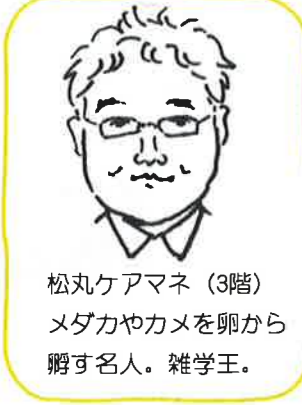
松丸ケアマネ (3階) メダカやカメを卵から孵す名人。雑学王。

カンファレンスには主に2つあります。一つ目は新規で入所してから約1ヶ月経過で行う合同カンファレンスです。サルビアでの生活の様子を説明し、見直し修正したケアプランの説明を行っております。二つ目は自宅に戻るご利用者に、居宅ケアマネージャーを交えて自宅での生活を想定し、自宅での介護サービスとの連携についてお話しするカンファレンスです。本来であれば、各職種とご家族が揃って輪になりお話しするのですが、感染対策の為、現在は各職種ごとの対応となっております。