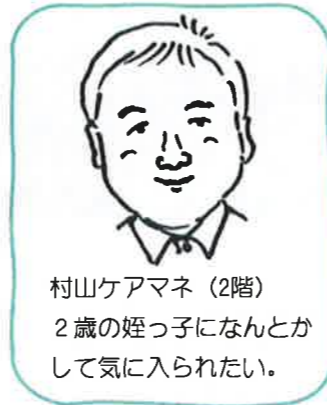
村山ケアマネ (2階) 2歳の姪っ子になんとかして気に入られたい。

ご利用者やご家族のご要望をお聞きして、ご本人の現在の状態を踏まえた上で、長期目標、短期目標、支援内容を決定しており『サルビアでの生活』において、その人らしい生活の継続や生活意欲の向上の為にケアプランを作成しています。ケアプランについては、3ヶ月毎に各職種と連携し、更新しております。