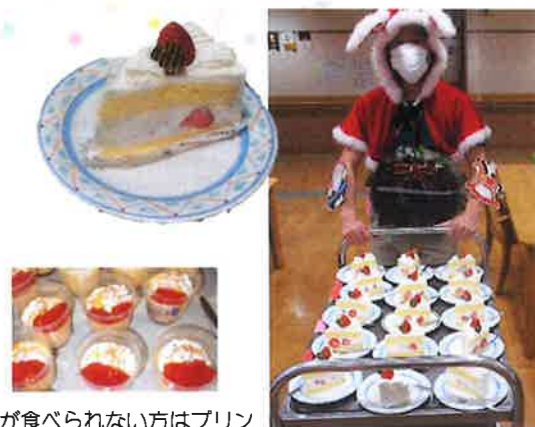
ケーキが食べられない方はプリン

12月18日各フロアにて「クリスマス会」が開催されました。直前まで出し物やバンド演奏を行おうと準備を重ねて参りましたが、コロナ感染拡大防止のため、実施することはできませんでした。サンタクロースから大きなショートケーキが配られると、皆様自然と笑みがこぼれます。「こんなに大きくて、立派なケーキがあるのね！」「おいしいわぁ〜」あちこちで喜びの声が聞かれます。出し物もなく、簡素な行事になってしまいましたが、幸せな時間が流れていました。