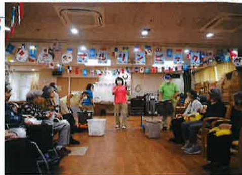
これから玉入れが始まります