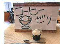
2Bのおやつ作りは コーヒーゼリーでした