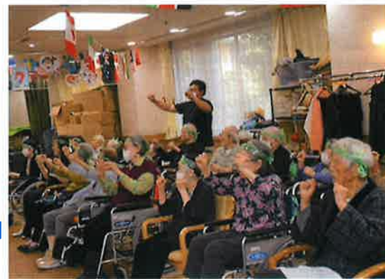
「幸せなら手をたたこう」に合わせて準備体操