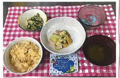
雨の日も 晴れの日も 楽しく

生姜の炊き込みご飯・みょうがかき卵汁 オクラと長芋の玉葱マスタード和え 鶏のムニエル・ジューズ・あじさいゼリー