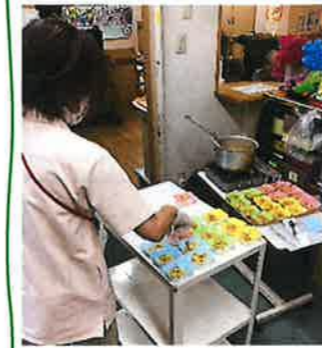
美味しく出来ました

3A職員が友人の山で筍をたくさん掘って、サビアに持ってきました。新鮮な筍だったので急きょ3Aのみですが、「たけのこレク」を開催しました。皆さん大きな筍を抱えると、採れたての感触に自然と笑みがこぼれます。職員が調理すると筍の良い香りが漂い、匂の味わいに大変喜ばれ、とても楽しいレクとなりました。