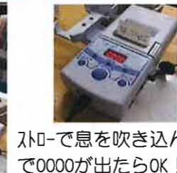
ストロ-で息を吹き込んで0000が出たらOK!

4月より運転者の運転前後の酒気帯び有無を対面で目視確認していましたが、10月の道路交通法施行ではアルコール検査器による確認が必要になりますが、いち早く導入し検査を実施しています。