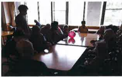
2Bではテーブルにボールを転がして打ち合いました

停電 災害による停電時には自家発電機が作動します。4月には自家発電機の年次点検を行いました。点検実施の間は館内の照明が消え暖房やエレベーターが使用できない中、各フロア毎ご利用者と職員と知恵を出し合い、レクリエーションを行うなどして混乱なく無事に終了することができました。