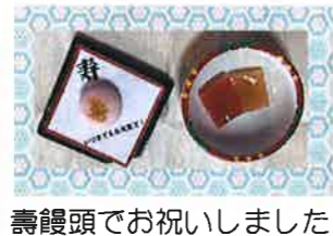
壽饅頭でお祝いしました

70歳 古希 88歳 米寿 77歳 喜寿 90歳 卒寿 80歳 傘寿 99歳 白寿 81歳 半寿 100歳 百寿 賀寿の方は 29名でした！