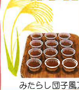
みたらし団子風プリン