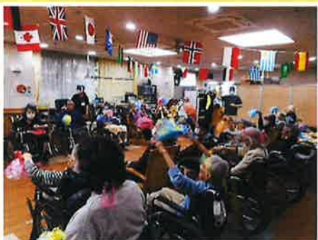
ポンポンを振ってパパラダンス

サルリンピック 9月4日2A・2B、5日3A・3Bの各フロア毎に、感染症対策をしてサルリンピックを開催しました。ミッキーマウスのテーマに合わせてパパラダンスで準備体操をした後、大玉送り、輪っかリレー、ハン食い競争などを行いました。多くのご利用者が積極的に参加され楽しい時間を過ごしました。